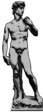
FREUD inconscient centré sur soi