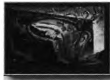
EINSTEIN relativité de l'espace-temps