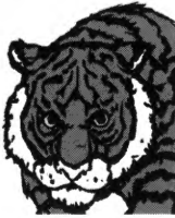
DARWIN survie du plus fort